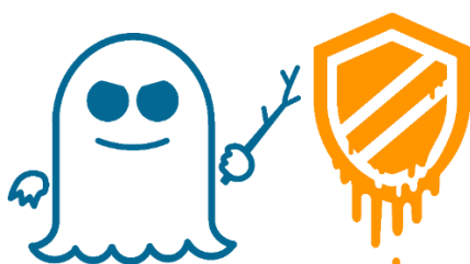
Abbildung 2: Spectre und Meltdown Angriff.

Konzept / Spezifikation und Chip-Entwicklung. Viele High-Tech-Chips wie CPUs für PCs und Server sind hoch-komplex. Obwohl immense Anstrengungen in Richtung einer hohen Sicherheit von Unternehmen wie Intel und AMD unternommen werden, führt die Komplexität der Chips unweigerlich zu unbeabsichtigten Schwachstellen. Die bekanntesten Beispiele aus den vergangenen Jahren sind die Angriffe Meltdown und Spectre 3 in CPUs [5, 4]. Die Angriffe nutzen komplexe Funktionen der CPU-Hardware aus, deren Implementierungsdetails nicht öffentlich dokumentiert waren. Die Folgen waren schwerwiegend, weil ten.